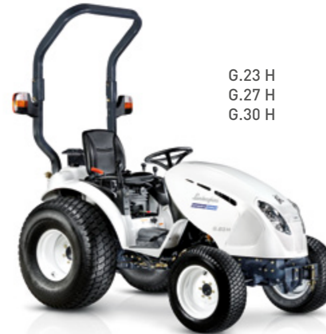
G.23 H G.27 H G.30 H

Pour garantir la fiabilité tout en réduisant les opérations d'entretien courant, toute la gamme Lamborghini Green Pro a été équipée de transmissions hydrostatiques. Ce qui revient à dire que les roues sont actionnées par un circuit hydraulique efficace. Ce choix technique simplifie l'utilisation du tracteur, le mettant ainsi à la portée des débutants, et élargit les possibilités d'utilisation ; quant à sa conception renforcée, elle représente une garantie de fiabilité.