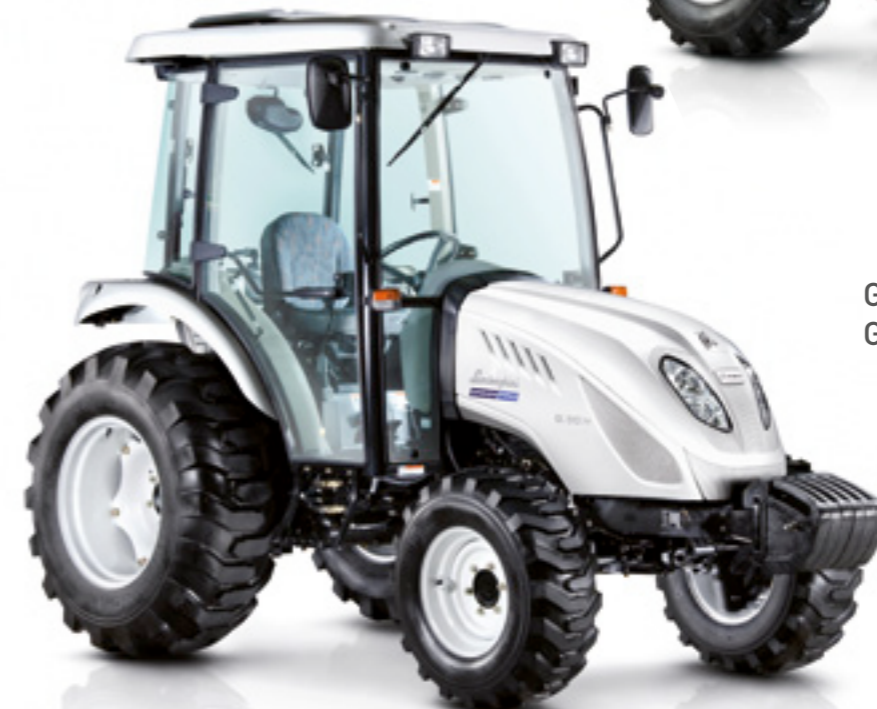
G.40 H G.50 H