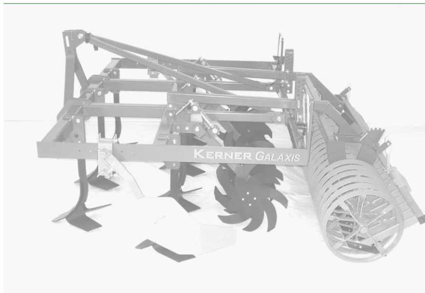
2-balkiger Grubberrahmen mit Flügelscharen, Sternverteiler V-förmig, Crackerwalze

Der Sternradgrubber Galaxis, besteht aus einem stabilen, verwindungsfreien Grundrahmen, an den in folgender Reihenfolge Werkzeuge angeordnet sind.