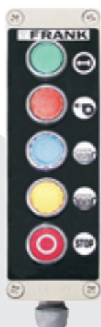
Fernsteuerung mit Programmwahl MSE-Z