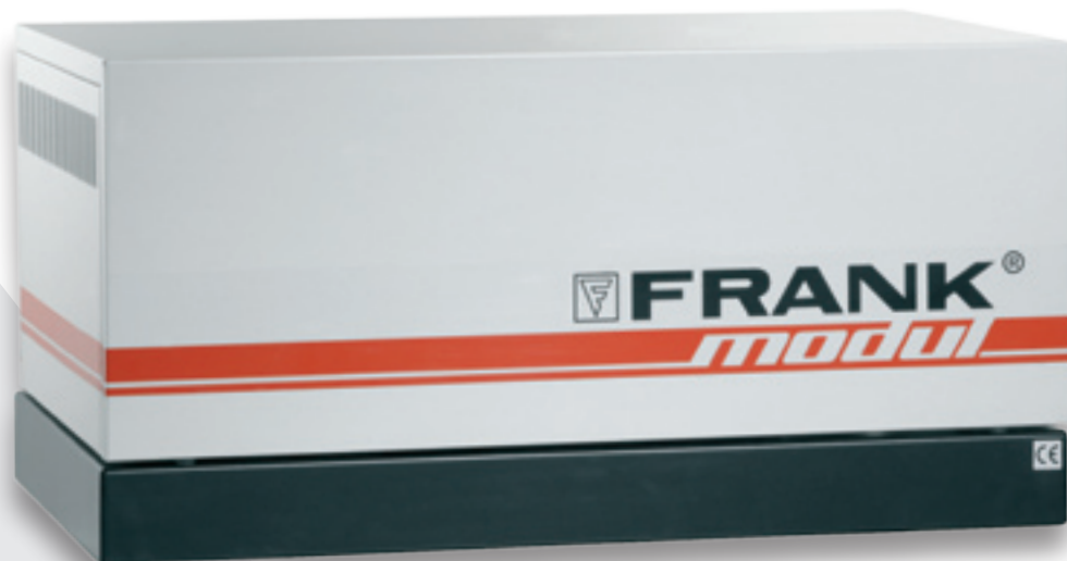
Wandmodul in Variante MSE-Z