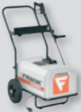
Hochdruckreiniger, mobil, unbeheizt