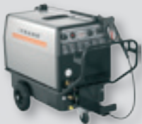
Hochdruckreiniger, mobil, öl- oder elektrisch beheizt