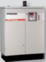
SB-Station, öl-, gas- oder elektrisch beheizt