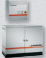
Wandmodul, stationär, öl-, gas- oder elektrisch beheizt