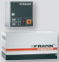
Wandmodul, stationär, unbeheizt