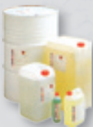
Zubehör und Ersatzteile